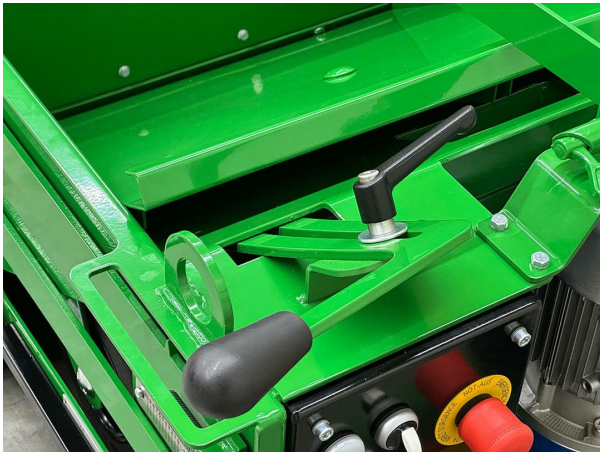
سلامة العملية تدفق المواد معتدل وثابت