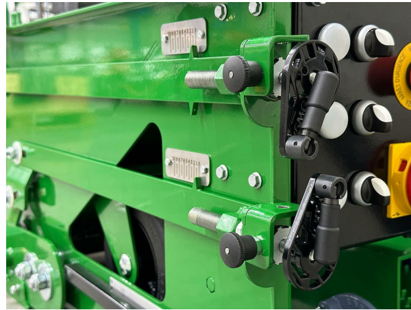
الدقة مغزل لضبط ارتفاع الثبيت والضغط