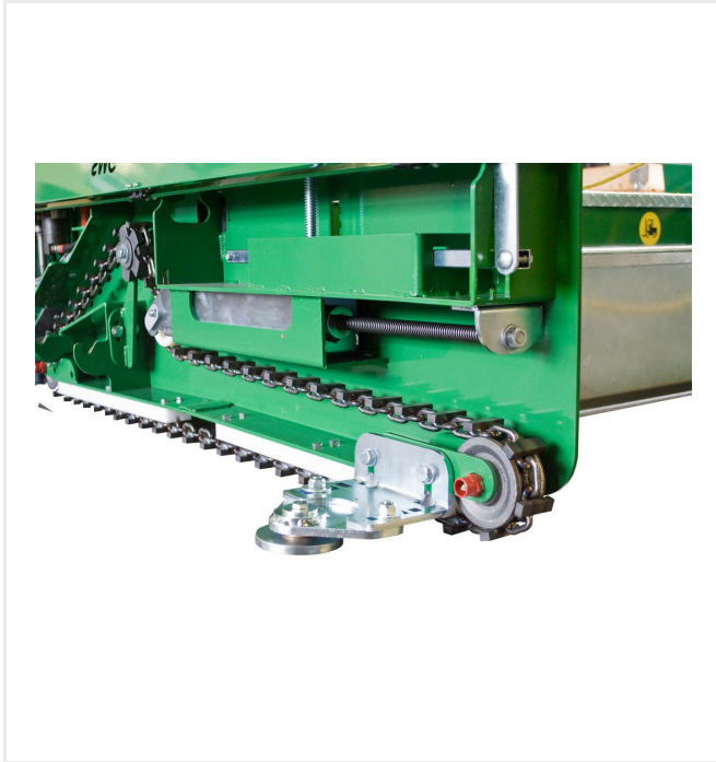
عجلة صد للتثبيت بمحارة حجارة الأطراف