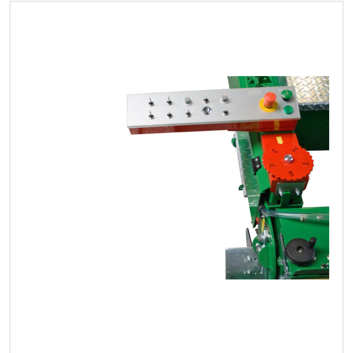
لوحة تحكم، على الجانبين