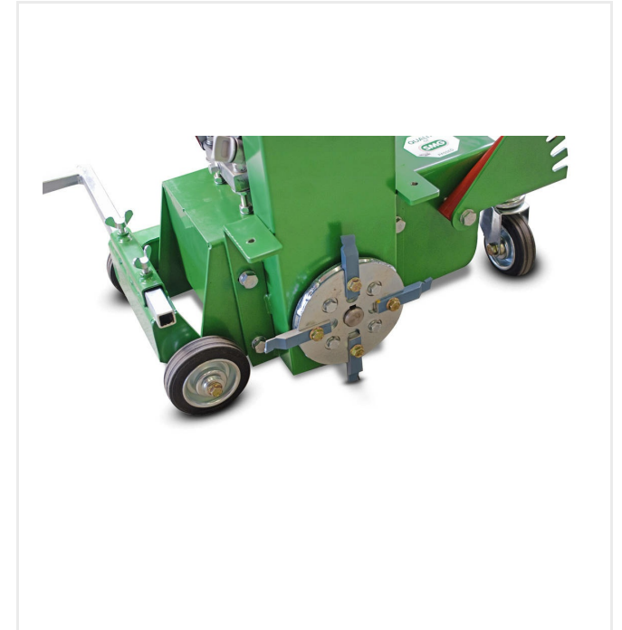
رأس قطع مزودة بـ 4 سكاكين من المعدن الصلب

تقوم آلة TF50 بقطع الأخاديد لتعليم الخطوط على المقاطع الجانبية البلاستيكية. لهذا السبب، فهي مجهزة بمعلمتين منفصلتين. وعمق العمل قابل للتعديل بلا حدود. ويتم ضمان القطع الدقيق بواسطة عصا قياس وبكرتين.