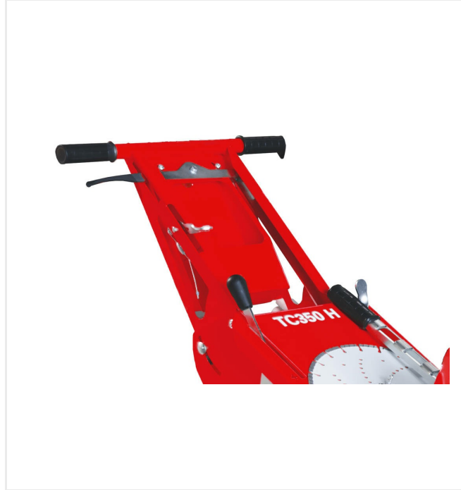
تروس هيدروليكية قابلة للتغيير بشكل لا نهائي