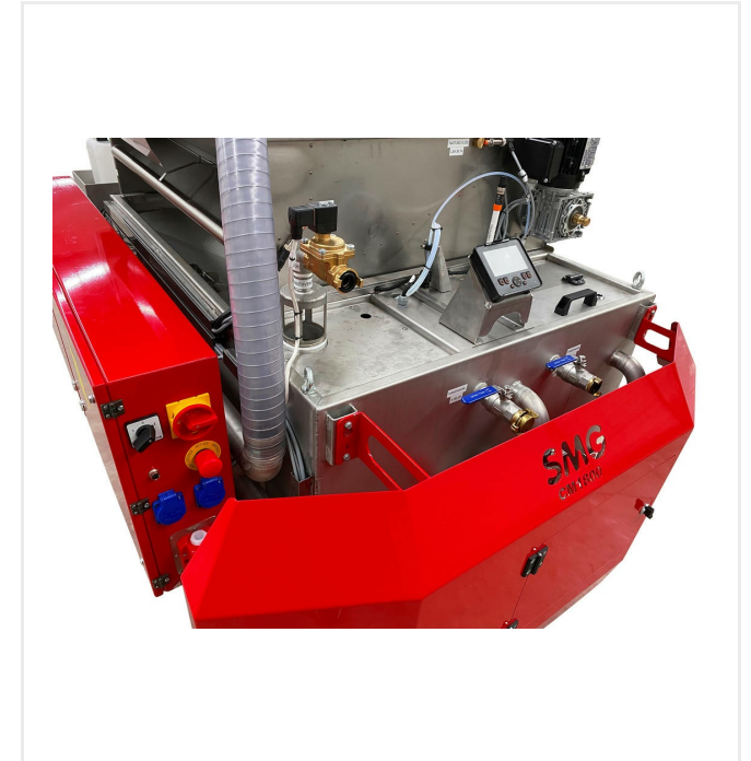
Zentraler Schaltkasten mit Display zur Ansteuerung sämtlicher Pumpen etc.