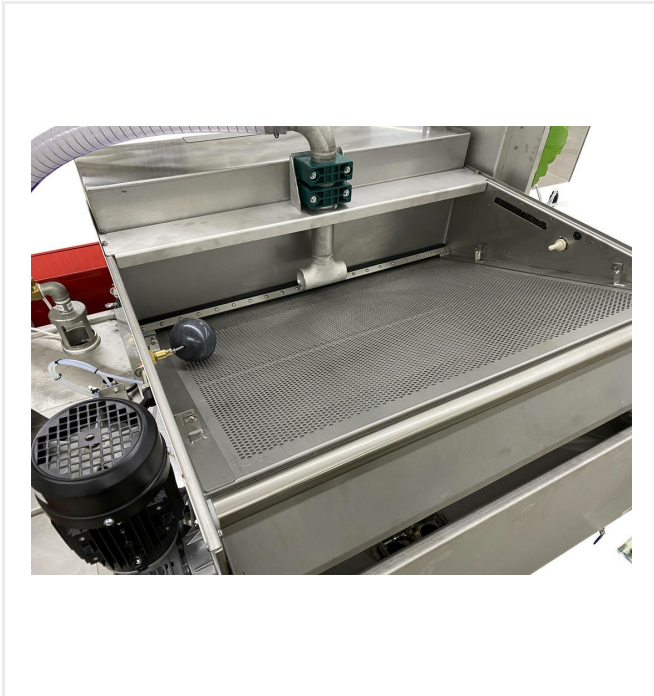
Bandfilter mit reißfestem Filtervlies (120 µm) inkl. Auffangbehälter mit Schwimmerschalter