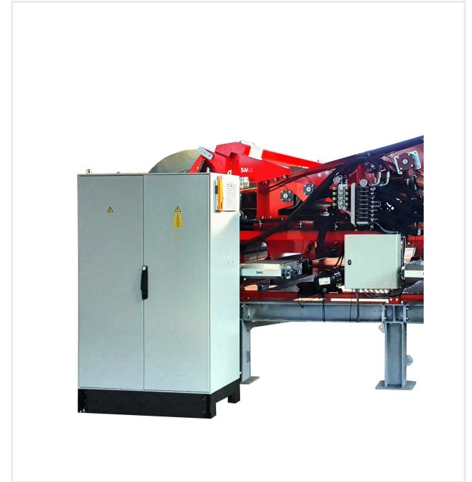
Schaltkasten mit Steuerung