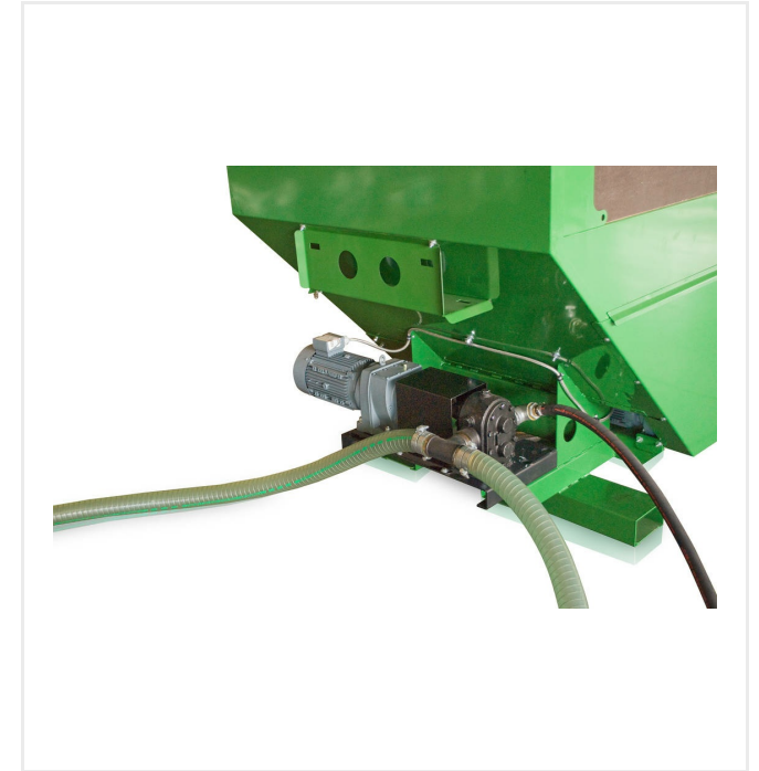
Ansaugpumpe und Bypass-Schlauch