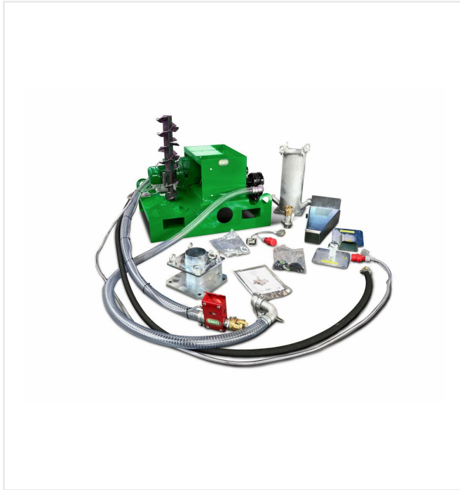
Transportables Dosierpumpenaggregat zum Mischen von Polyurethan-Beschichtungen (Option 2)