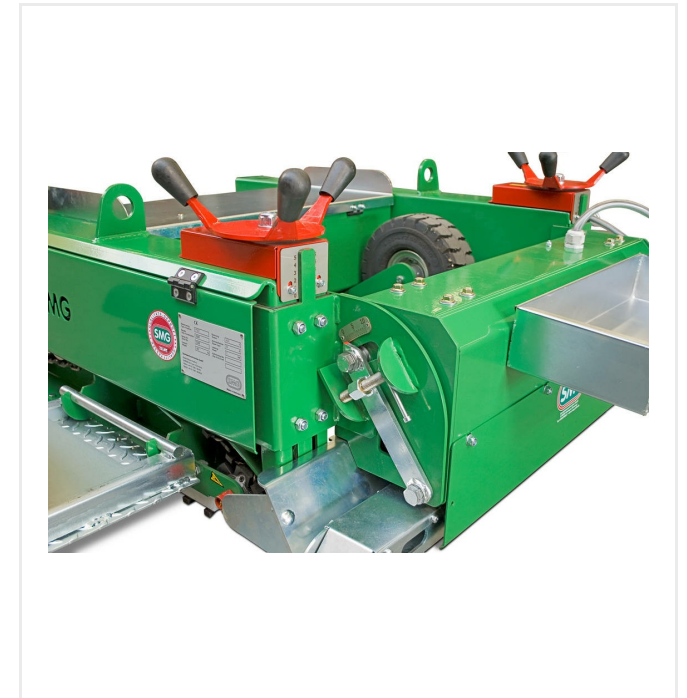
Neigungsverstellung der Glättbohle, manuelles Handrad zum Einstellen der Einbaustärke