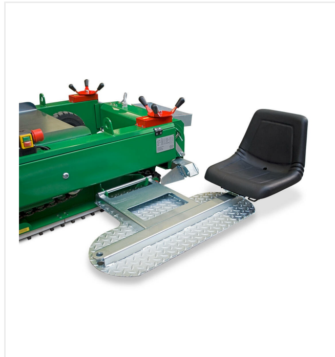
Sitzplatte mit verstellbarem Sitz, beidseitig zu befestigen, zum Transport schwenkbar