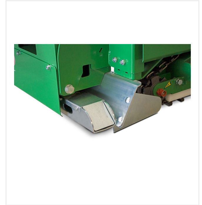
Beheizte Glättbohle mit seitlichem Materialbegrenzer für homogenen und nahtlosen Einbau