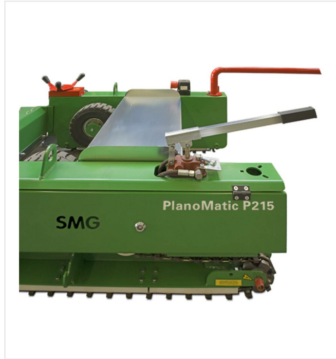
Hydraulische Handpumpe zum Ein- und Ausfahren des Fahrwerks