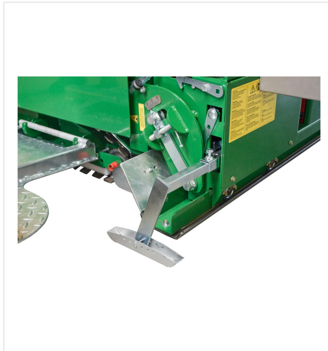
Integrierte Höhennivellierung für ebenflächigen Einbau