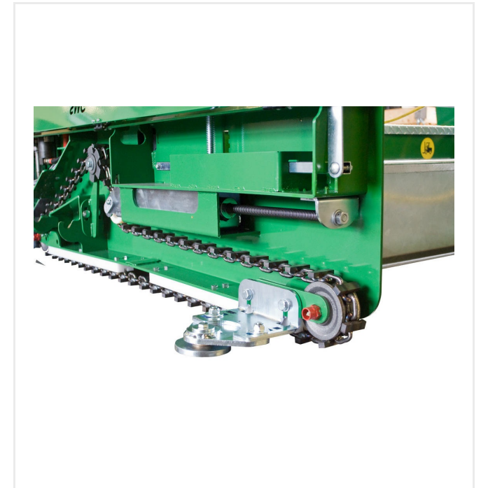
Abweiserrolle für den Einbau entlang von Kantensteinen