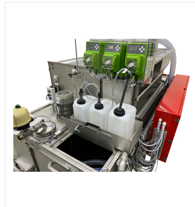
Tanque de almacenamiento y estación de dosificación para floculantes, opcionalmente agentes de limpieza, etc.