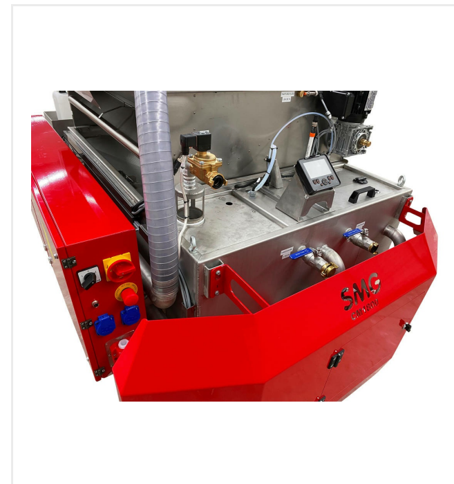
Panel de interruptores central con pantalla para controlar todas las bombas, etc.