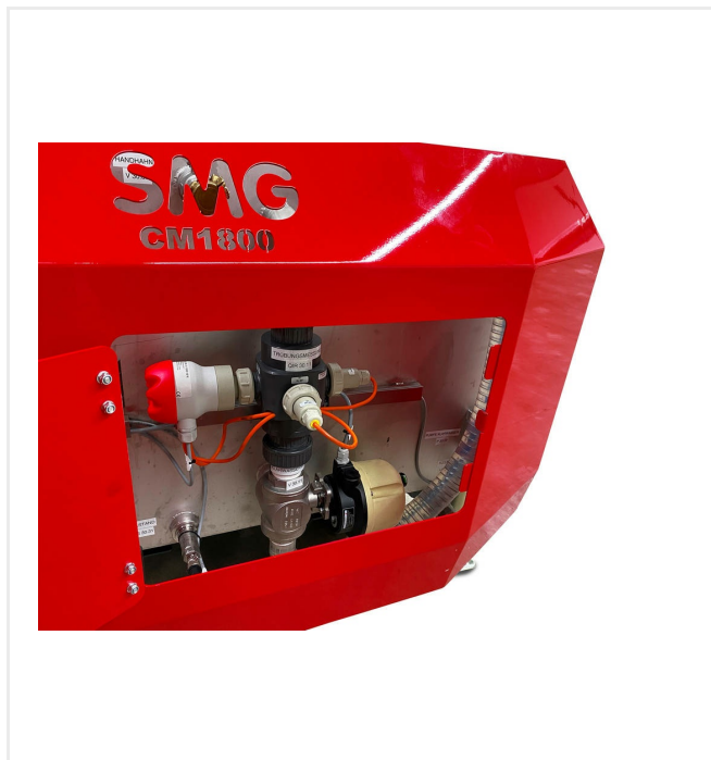
Sensores para comprobar la turbidez, el caudal y los niveles de llenado