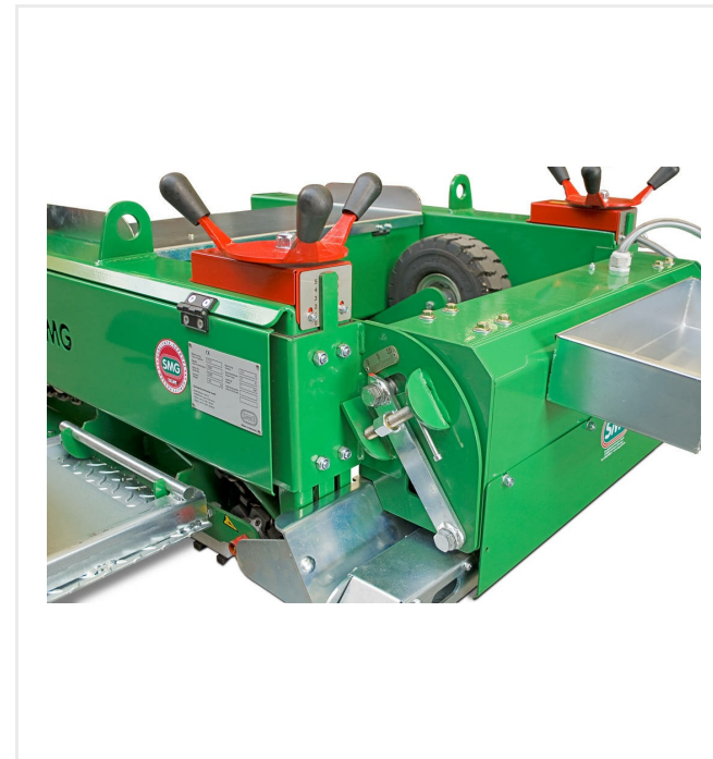
Ajuste de inclinación de la regla, rueda para ajuste manual del espesor de la instalación