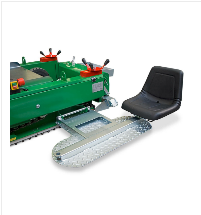
Placa de fijación de asiento. Puede colocarse a ambos lados de la máquina