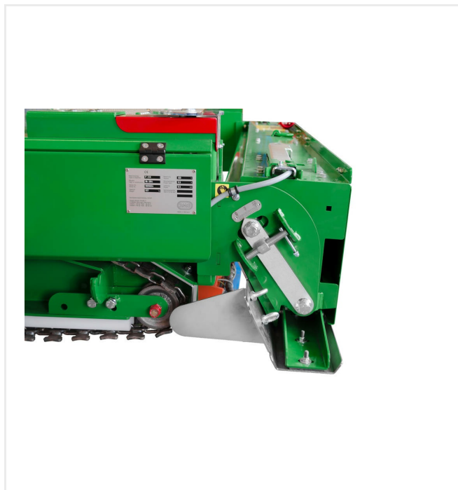
Ajuste de inclinación de la regla, limitador de material lateral para una instalación homogénea y sin problemas