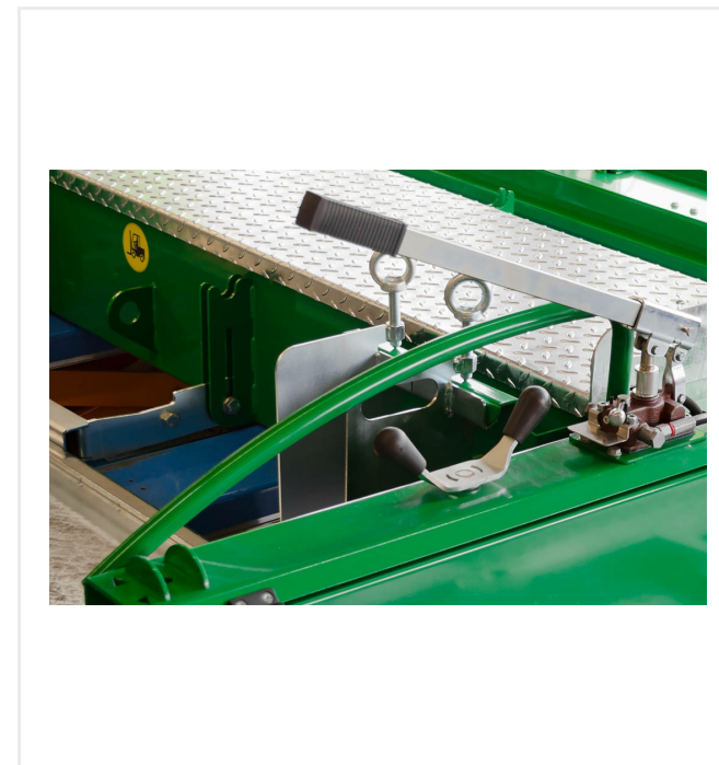
Bomba de mano para la retracción / extensión manual del chasis de transporte