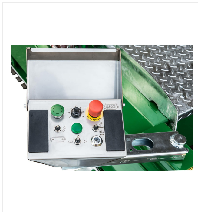
Panel de mandos eficiente y de facil manipulación