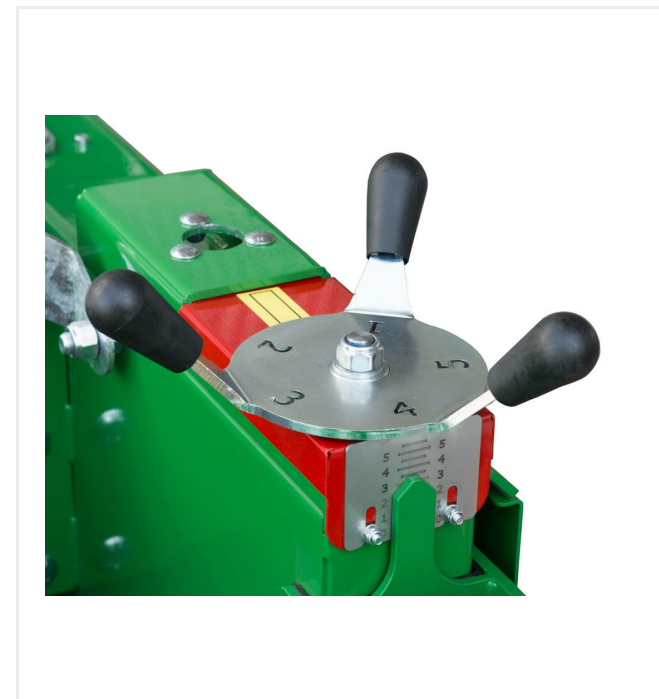
Rueda para ajuste manual del espesor de la instalación