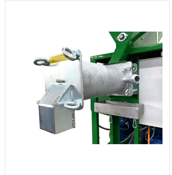
Ahorro de tiempo en la limpieza

Engranaje ajustable para los contenedores de material.