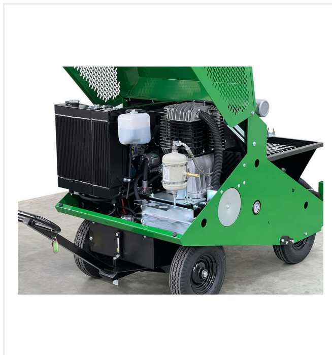
Radiador de altas prestaciones

Motor diesel Kubota con un radiador combinado para refrigeración del motor y del sistema hidráulico.