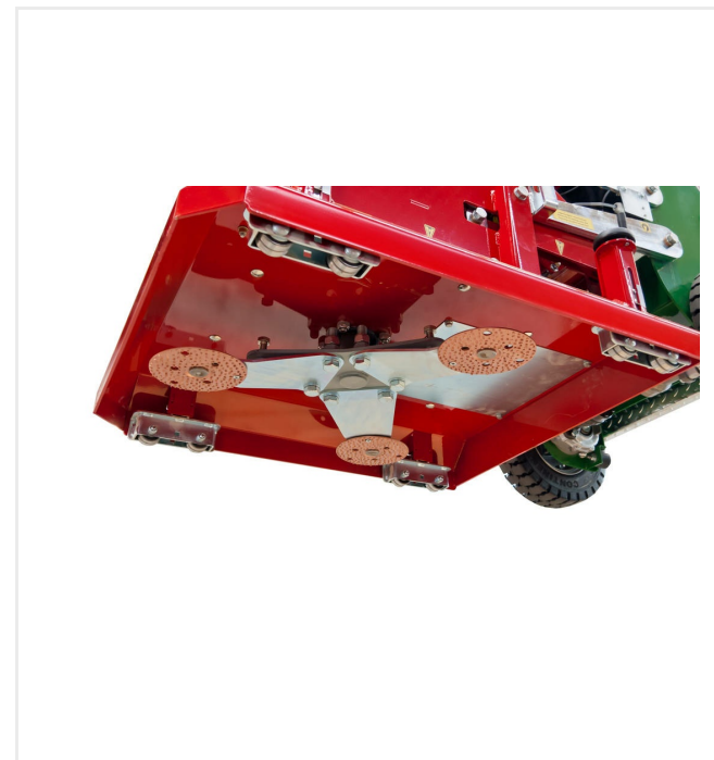
El emplazamiento de los platos abrasivos evita marcas en la superficie