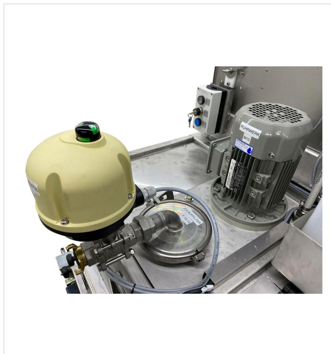
Zbiornik na zanieczyszczenia ze zintegrowanym filtrem wlotowym (<5 mm) jak również jednostka mieszająca