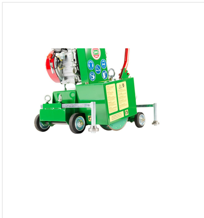
Maszyna do wycinania rowów TF50