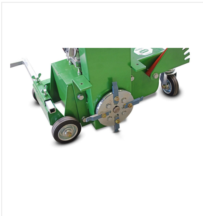
Głowica noży z 4 sztukami noży uderzeniowych wykonanych z metalu twardego