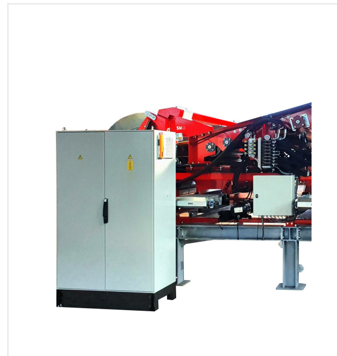
Skrzynka rozdzielcza ze sterowaniem