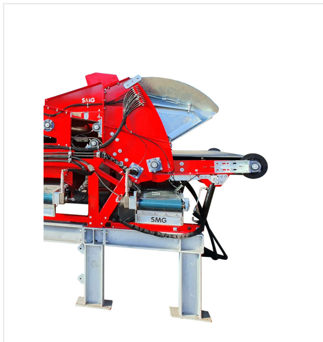
Obszar dla rolek ze sztucznej trawy