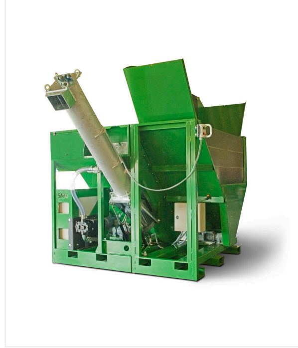
مع وحدة حصى