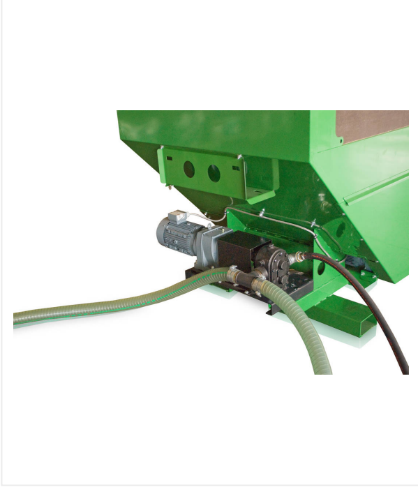
مضخة شفط وخرطوم جانبي