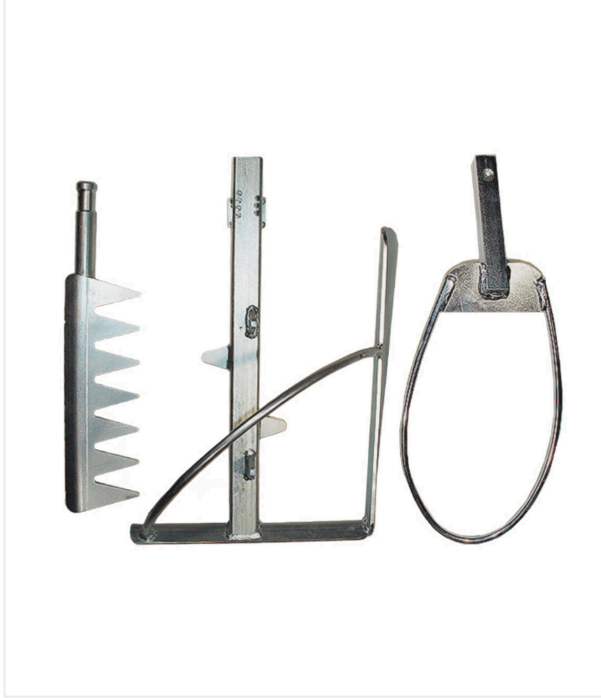
تضمن أداة الخلط الخاصة خليطًا متجانسًا