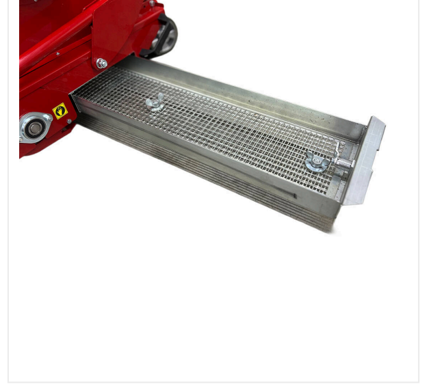
قابلة للتعديل بسلاسة غربال مرشح قابل للاستخراج متوفر بأحجام مختلفة.