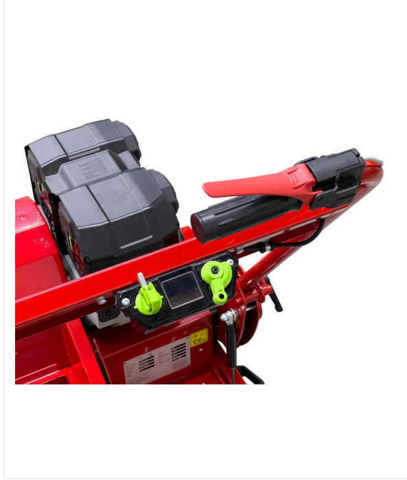
سهولة التعامل ضوابط التشغيل مرتبة هندسياً.