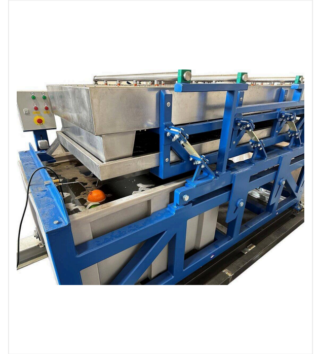
نظام الغريلة الرطبة