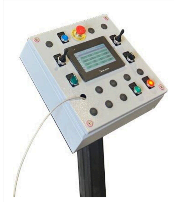
لوحة تحكم مركزية