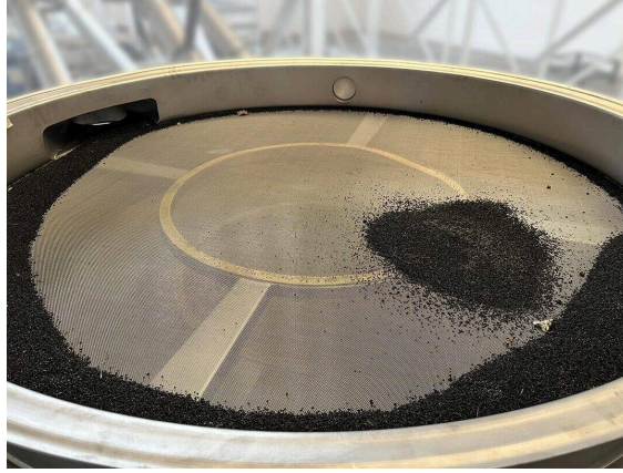
نظام غربلة البهلوانات