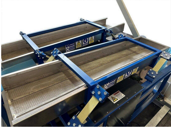
نظام نرح المياه بالاهتزاز