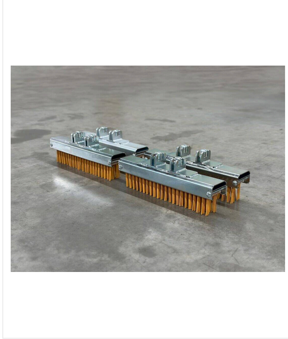
فرشاة صيانة للعشب الصناعي فرش مختلفة التكوين والصلابة