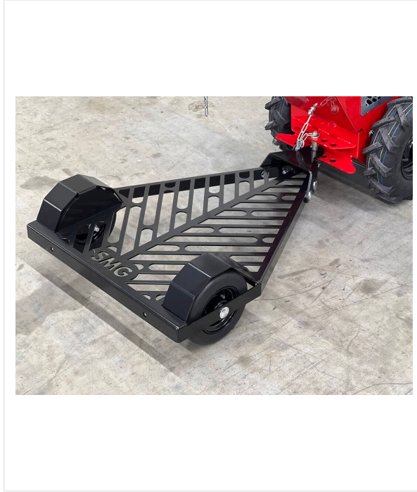
اختياري عربة واقفة