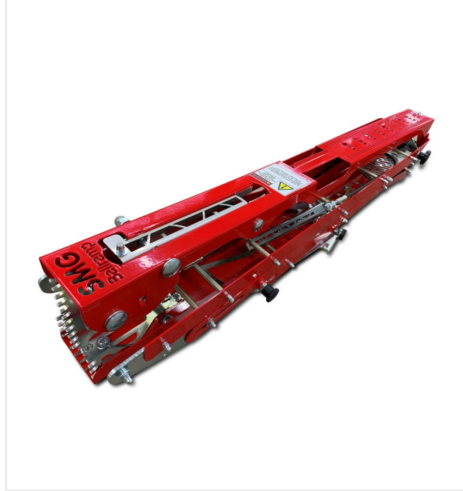
قابل للطي من أجل النقل الموفر للمساحة