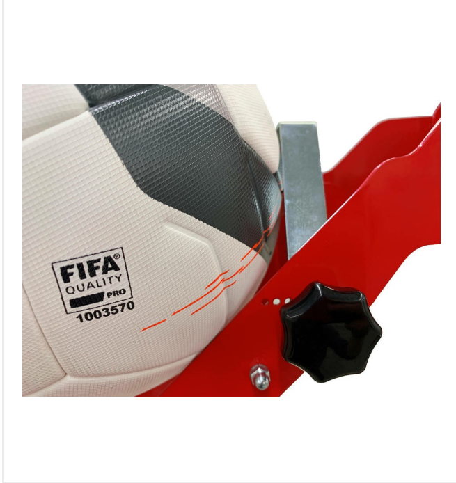
وضع إطلاق قابل للقفل من أجل الكرة