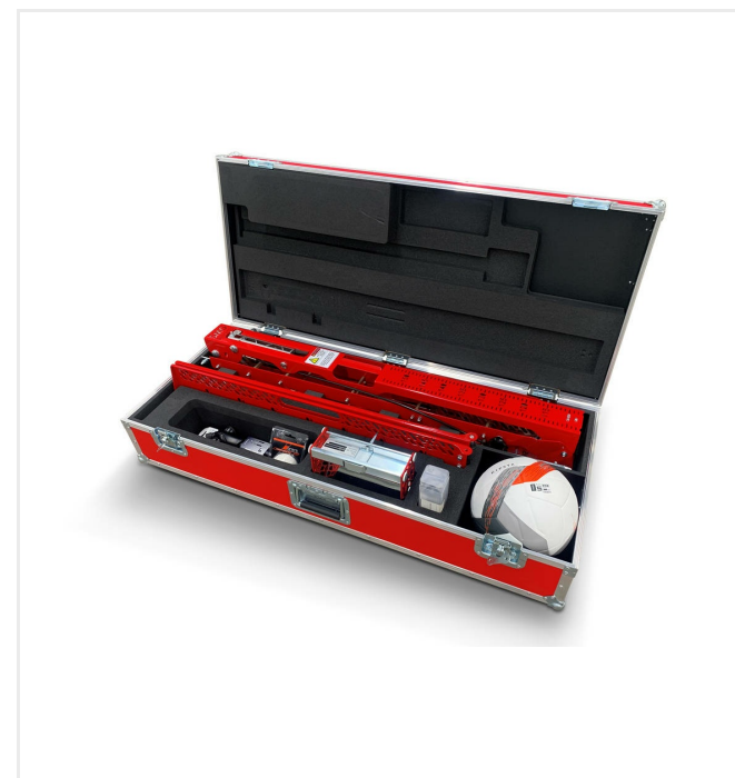
صندوق نقل بعجلات