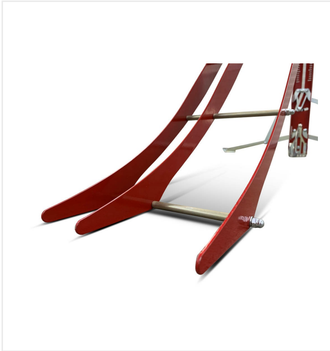
أقدام ومخالب داعمة قابلة للتعديل لوضع وقوف مثالي مجريان للهوكي وكرة القدم