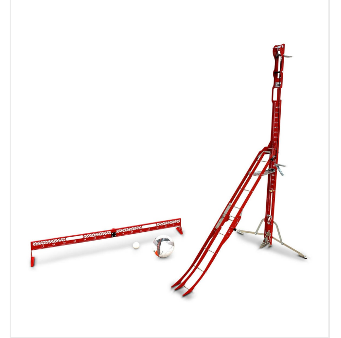
منحدر كرة ممتاز