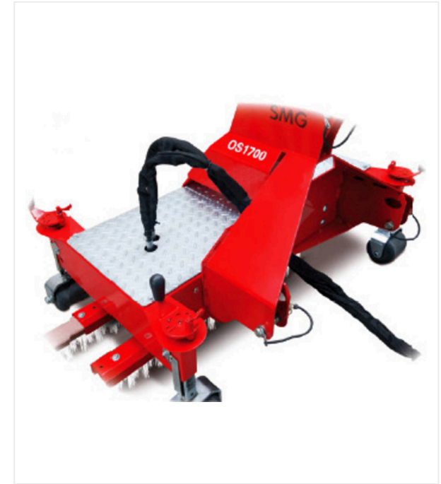
mit Heckdreipunktaufnahme, Antrieb hydraulisch