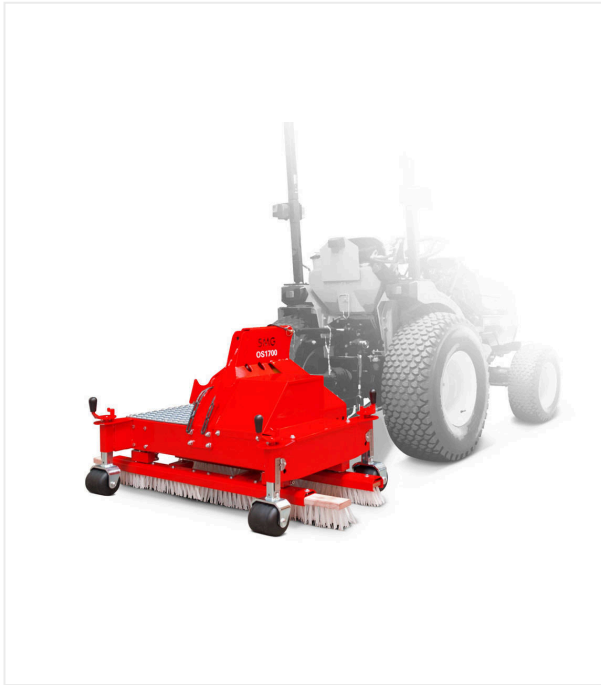
Oszillationsbürste OS1700/OS1700 PTO