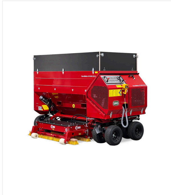
SandMatic B1505 ECO