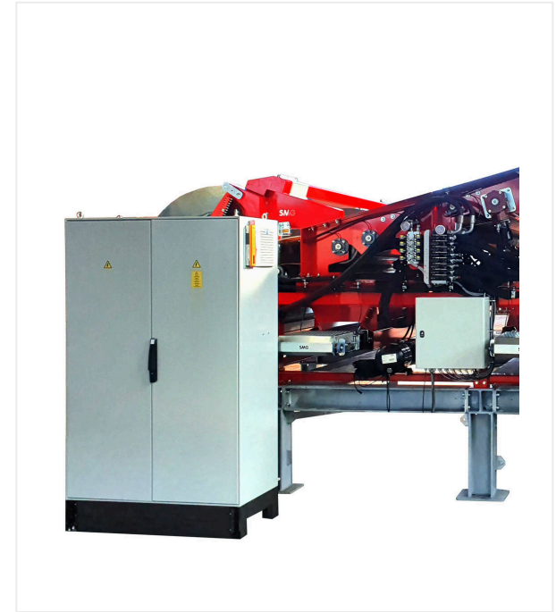
Schaltkasten mit Steuerung