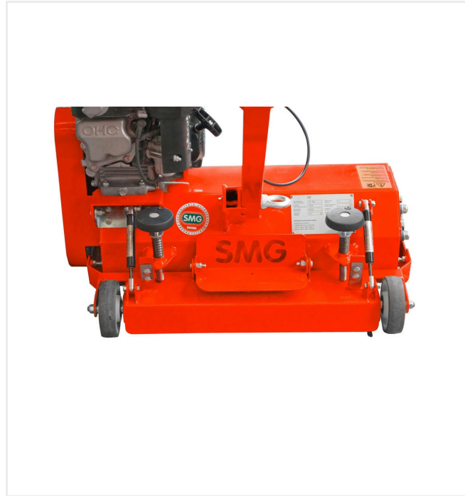
Arbeitstiefe über Anschlag einstellbar