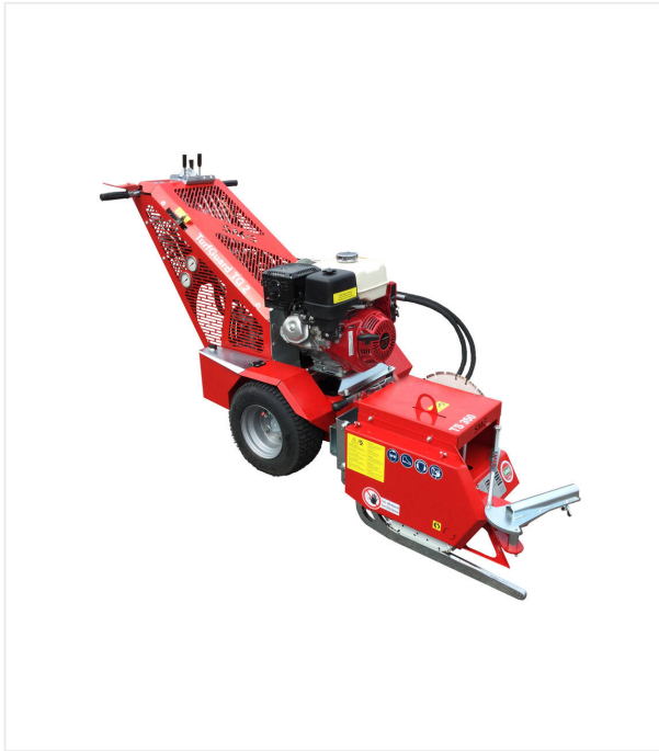
TurfSaw TS350 als Anbaugerät des TurfGuard TG2