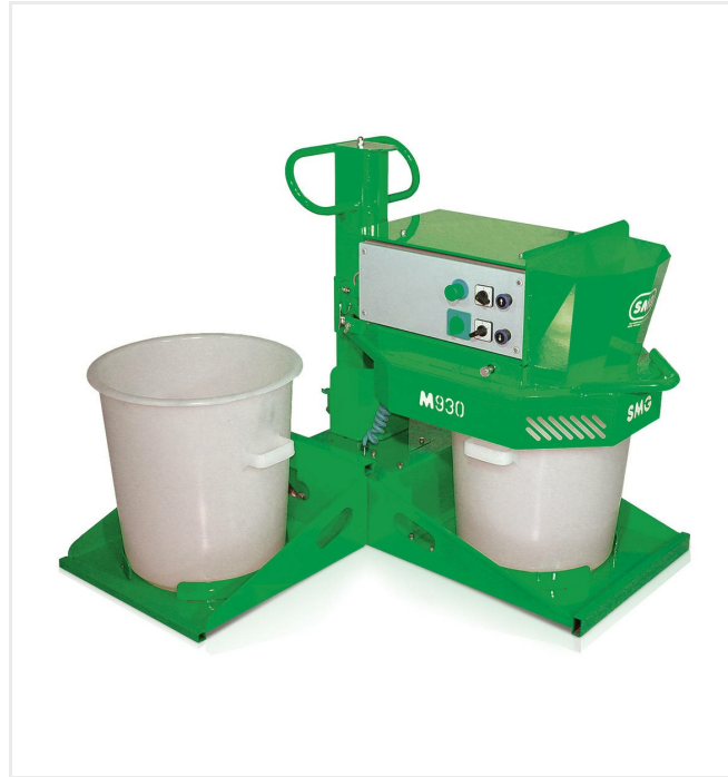
Mischkopf bis Arbeitshöhe hydraulisch abzusenken