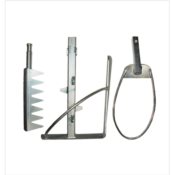
Spezielles Mischwerkzeug gewährleistet homogenes Vermischen