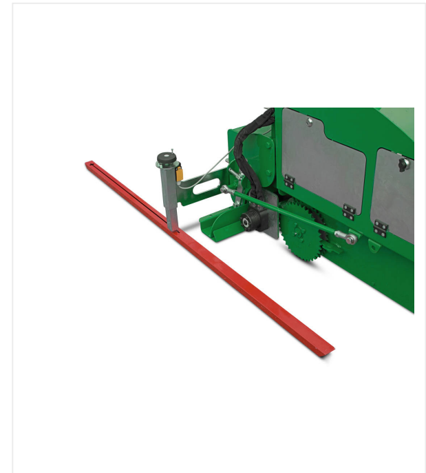
Optionale Tastschiene zur Abtastung des Unterbodens