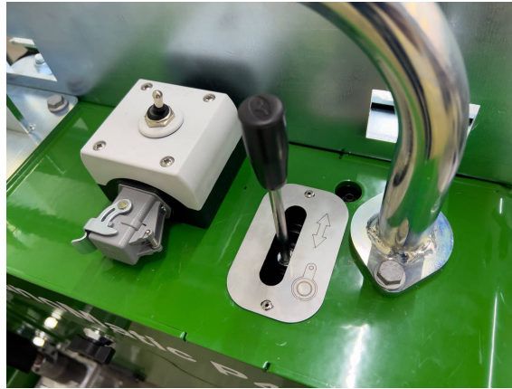
Anschluss für optionale Abtastung