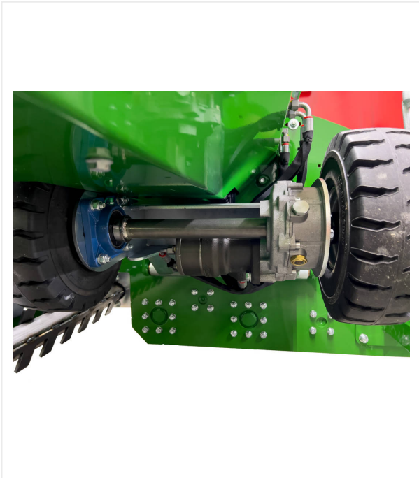
Fahrwerk mit Eigenantrieb