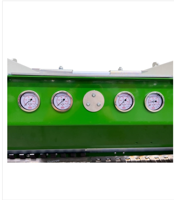
Druckmanometer der Hydraulikdrücke