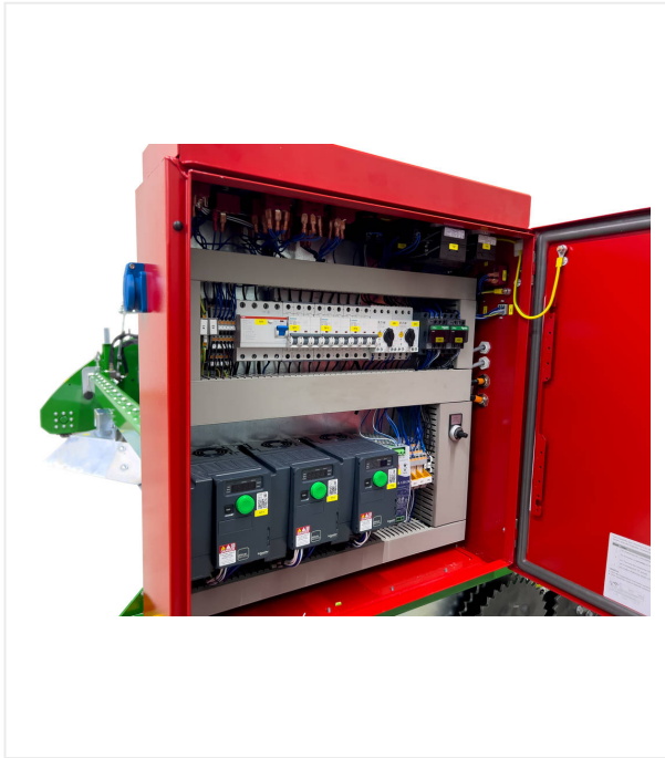
Schaltkasten mit Frequenzumrichtern