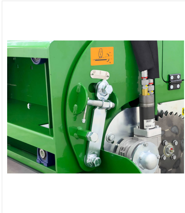
Einstellung der Verdichtung