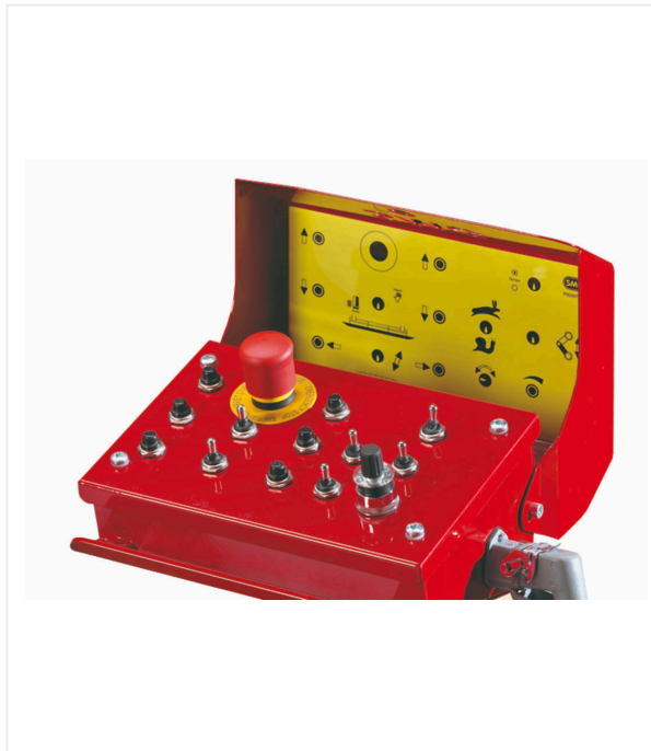
Zentrales Steuerpanel, schwenkbar