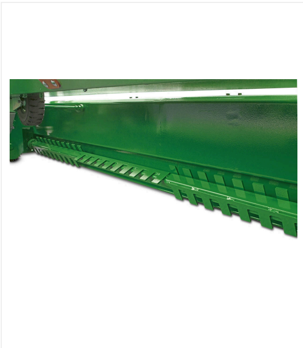
Paddelwelle für gleichmäßige Verdichtung