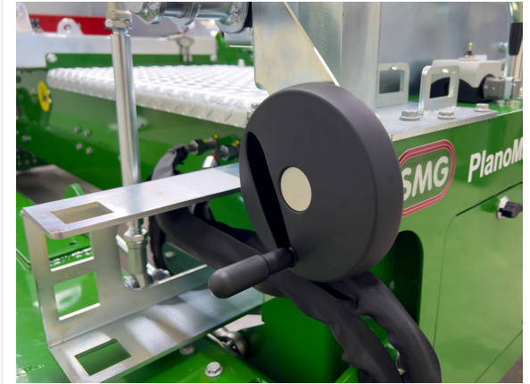
Einstellrad für Einbauhöhe