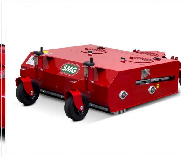
Cleaning brush PGSG1