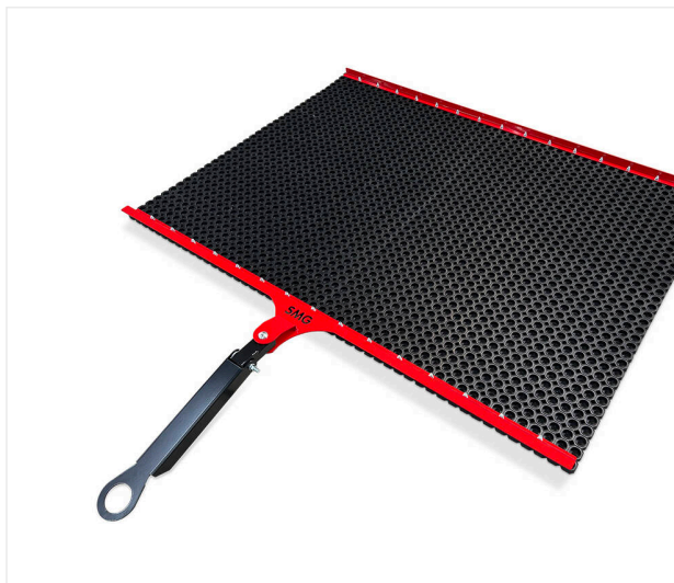
Alfombra de goma