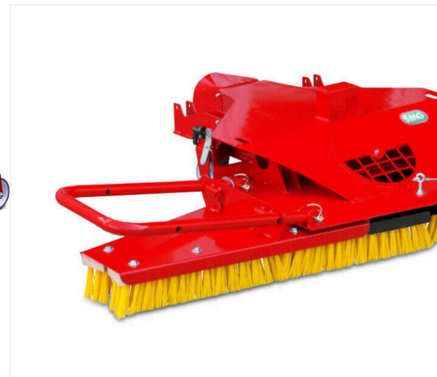
Rigid brush device