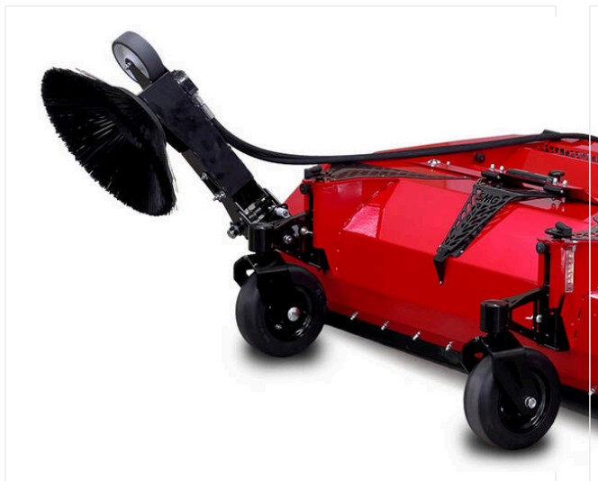
Cepillo rotativo SC3