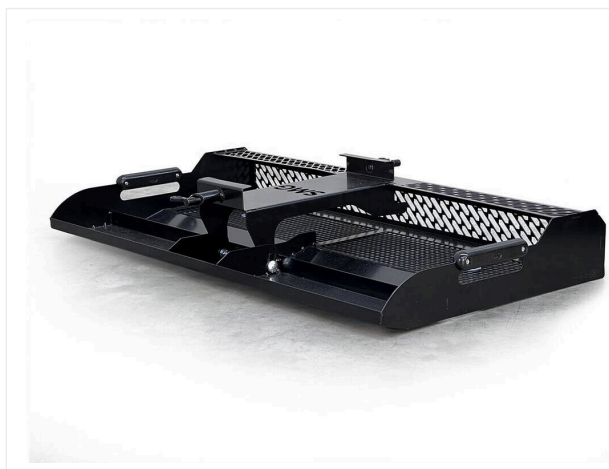
Recogedor de hojas LS900

Remolque con ruedas para césped artificial.