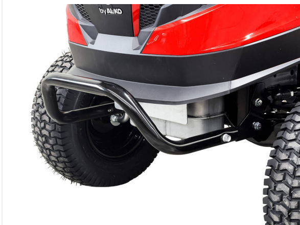
Seguridad Parachoques robusto para protección contra colisiones