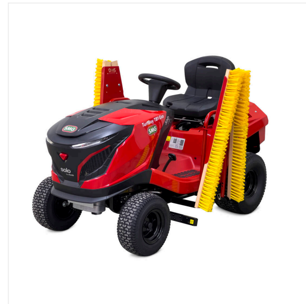
Compacto Cepillos plegables.