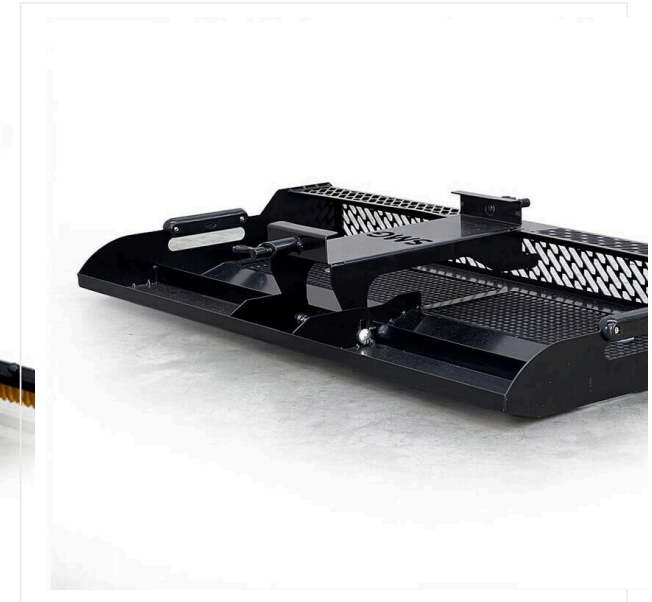
Recogedor de hojas LS900

Remolque con ruedas para césped artificial.