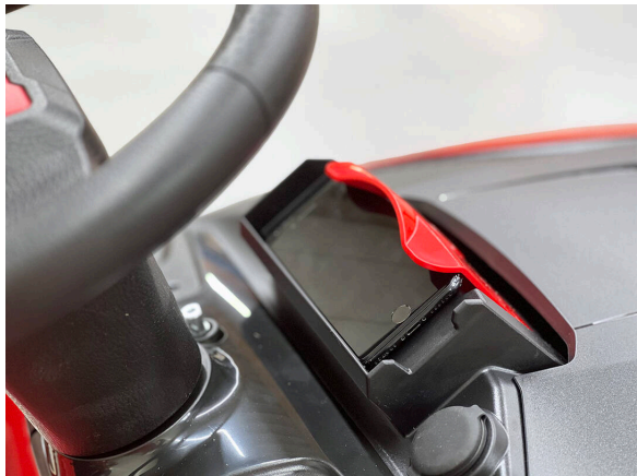
Soporte de conexión para smartphones.