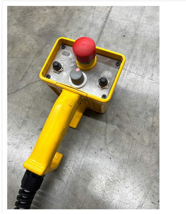
Mando manual en Version ECO con cordón en espiral de 3 metros.