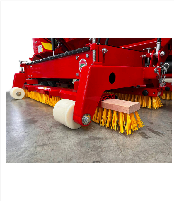
SMG Cepillo oscilante