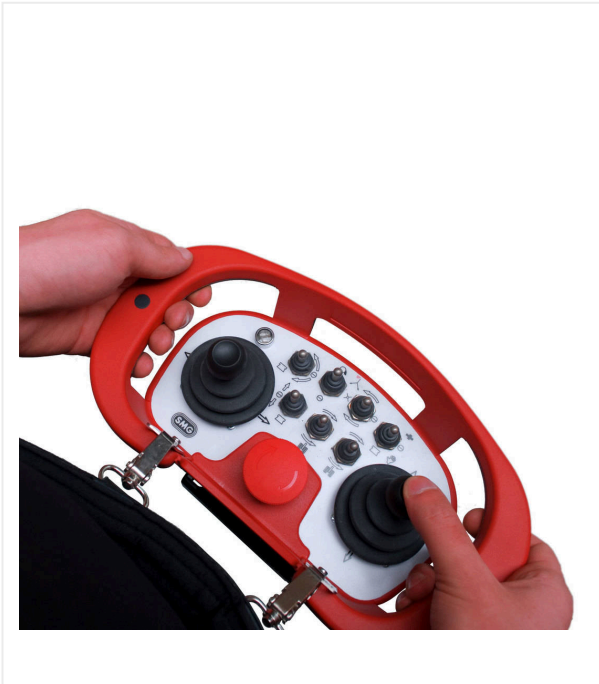
Panel de control remoto profesional / SandMatic B1505 RC