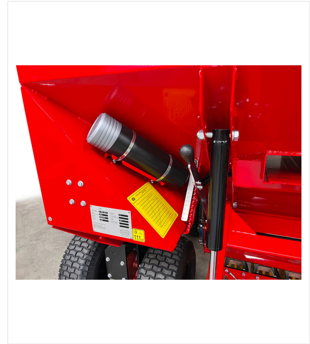
Espesor de carga

para erigir la fibra y cepillar simultáneamente el material de relleno.