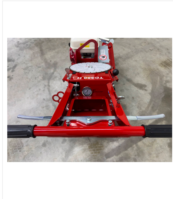
Vista del operador