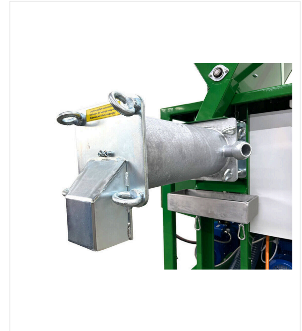
Ahorro de tiempo en la limpieza

Engranaje ajustable para los contenedores de material.