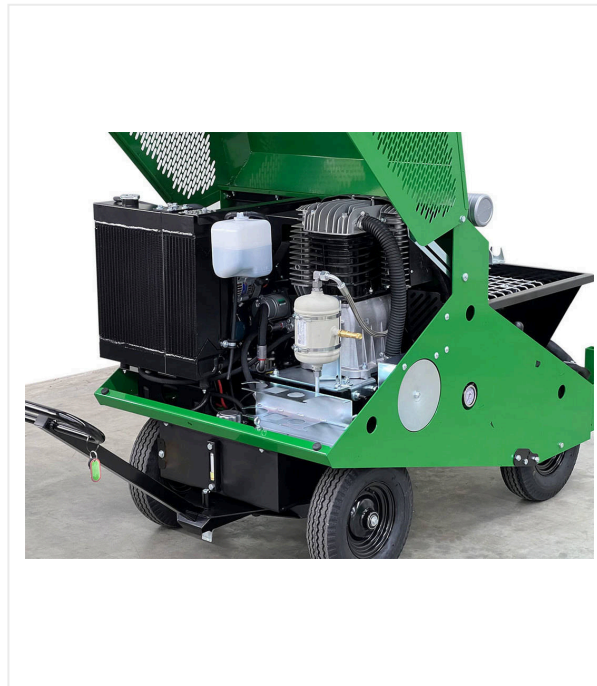
Radiador de altas prestaciones

Motor diesel Kubota con un radiador combinado para refrigeración del motor y del sistema hidráulico.