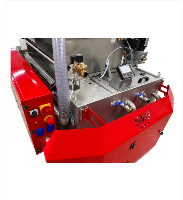
Panel de interruptores central con pantalla para controlar todas las bombas, etc.