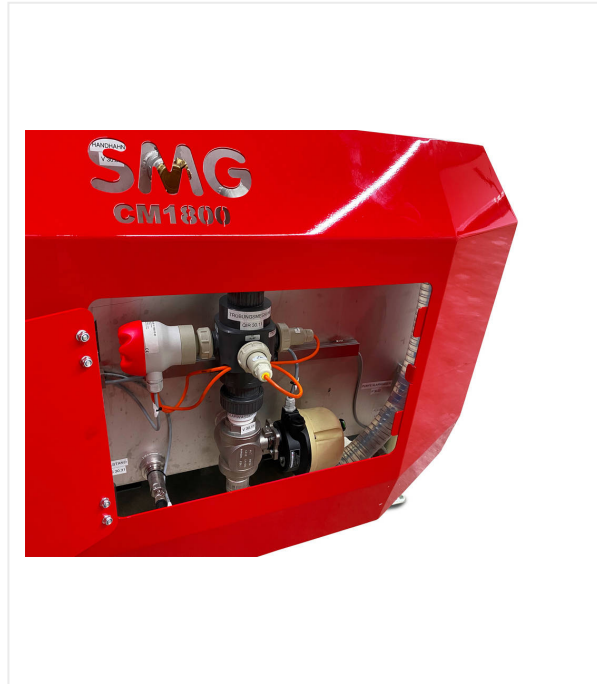
Sensores para comprobar la turbidez, el caudal y los niveles de llenado