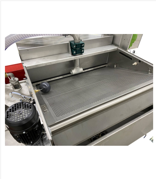
Filtro de banda con tamiz filtrante resistente al desgarro (120 µm) que incluye recipiente colector con interruptor flotante