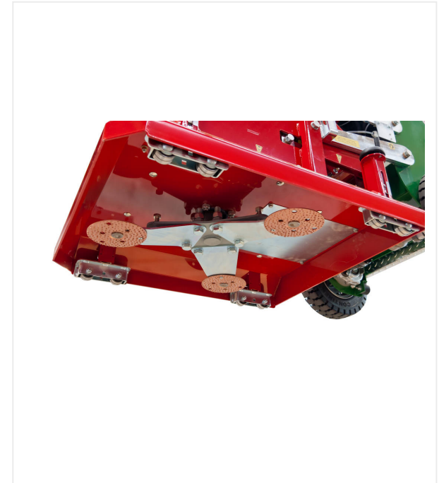
El emplazamiento de los platos abrasivos evita marcas en la superficie