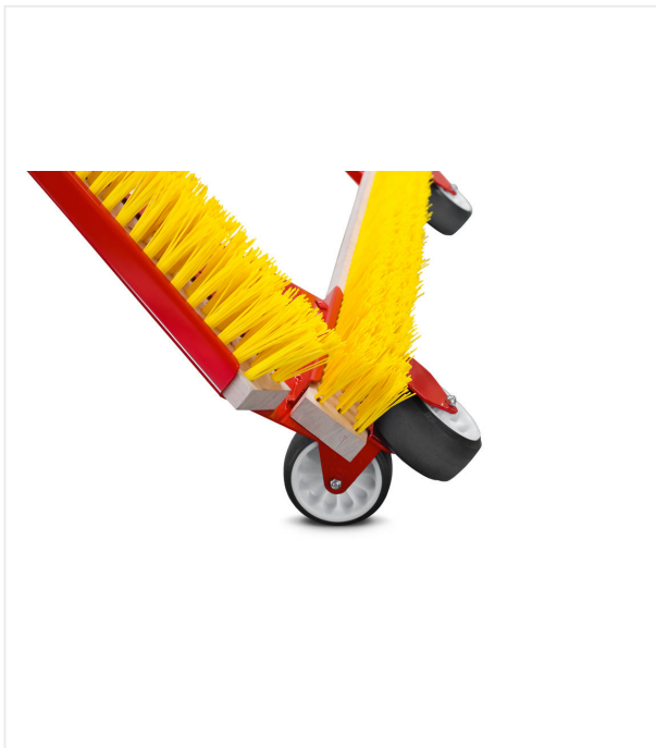
4 Roues de transport pour le déplacement de la machine