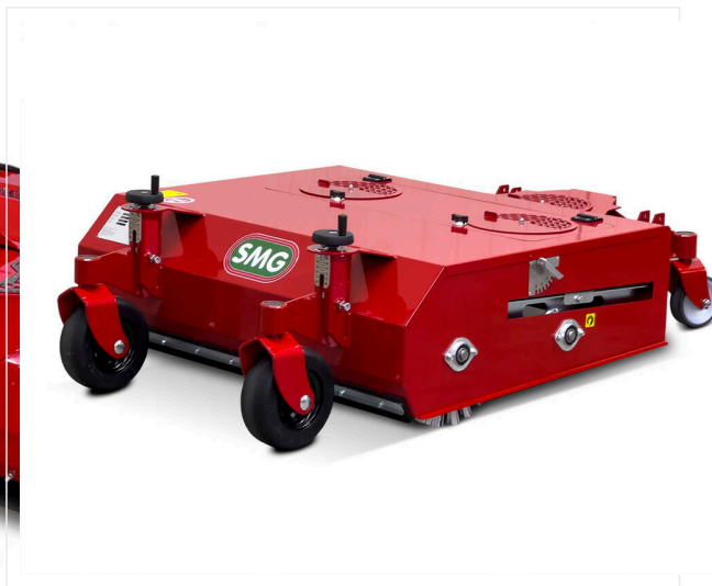
Brosse de nettoyage pour gazon synthétique avec remplissage