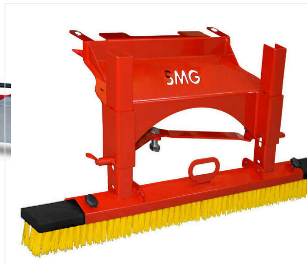
Brosse d'égalisation du matériau de remplissage