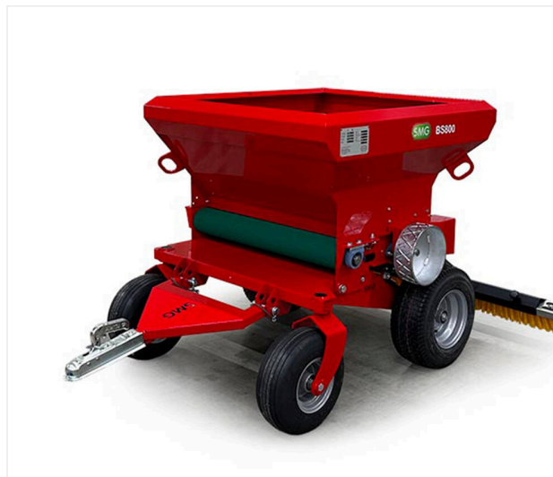
Épandeur a bande BS800