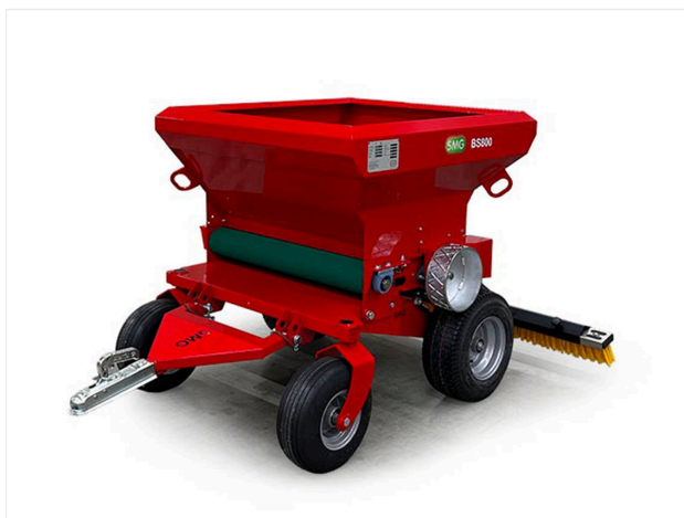
Épandeur a bande BS800