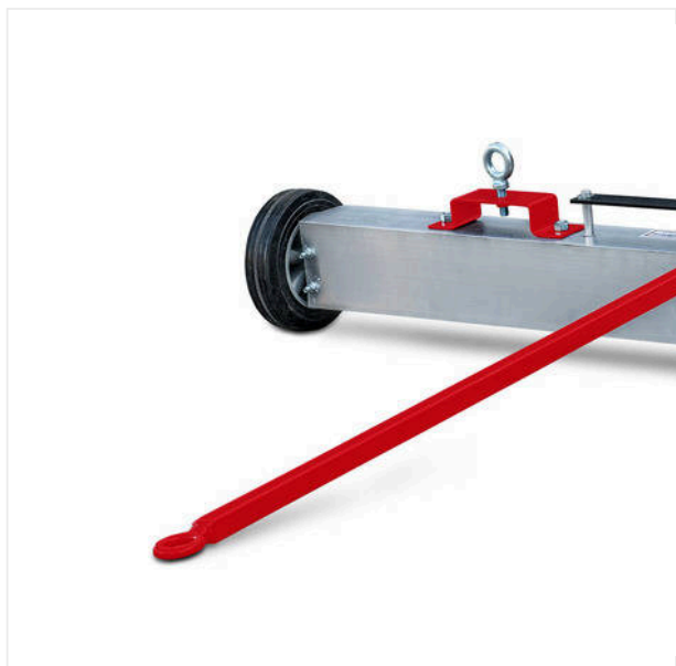
Barre aimantée ML1500