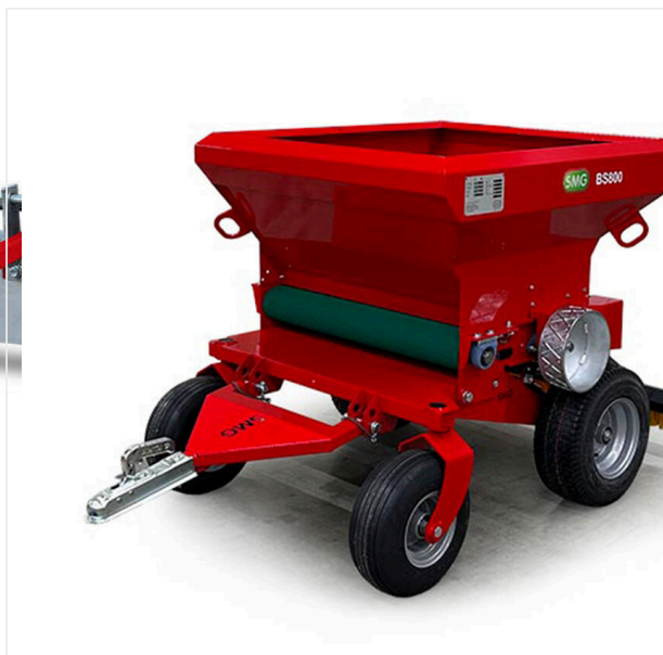
Épandeur a bande BS800

Barre aimantée ML1500 pour la maintenance des gazons synthétique.