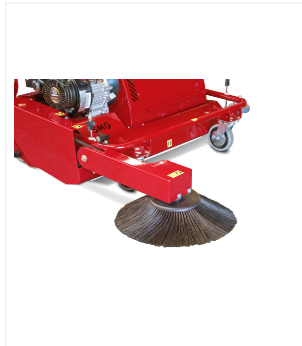
Balai latéral rabattable

Équipé d'un balai latéral rabattable pour les salissures situées aux endroits difficiles d'accès