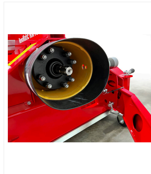
Mise à jour

Vis de transport de grande taille pour des performances de transport élevées.