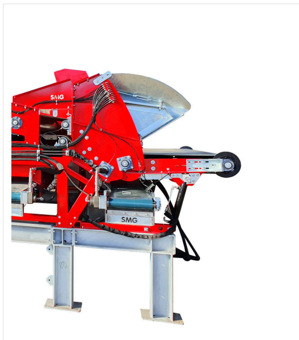
Zone d'entrée pour les rouleaux de gazon artificiel