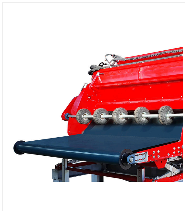
Enrouleur pour rouleaux avec galets